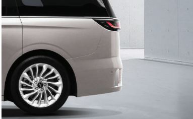
MULTI-LINK (REAR SUSPENSION)