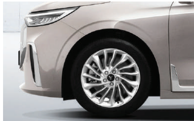
ADJUSTABLE CHASSIS HEIGHT (60 MM RANGE)