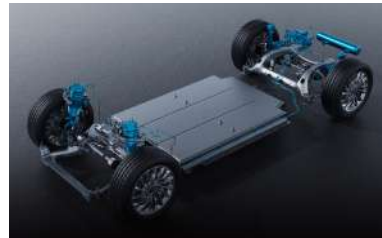
SPEED ADAPTIVE CHASSIS + EASY ACCESS MODE