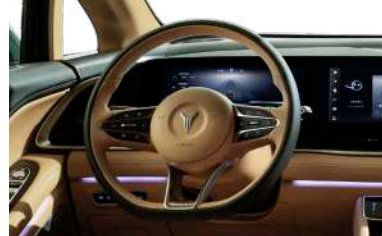
DRIVING MODES: ECO, COMFORT, SPORT, TOUR, SNOW, CUSTOM