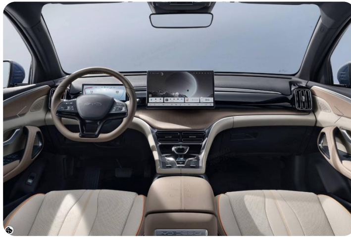
Beige x Brown